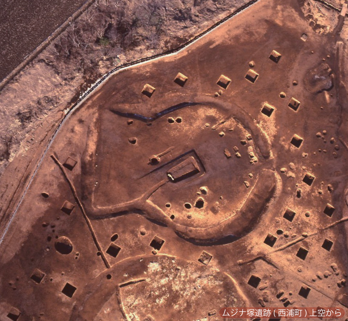
ムジナ塚遺跡(西浦町)上空から