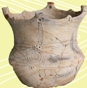
四ツ道北遺跡(高萩町) 縄文土器