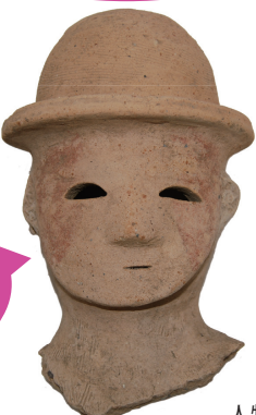
人物埴輪 唐沢山ゴルフ場ハニワ窯跡(富士町)