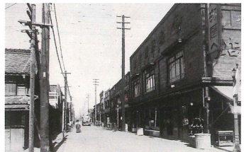
昭和初期の殿町通り