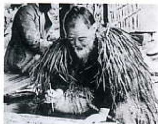
被害地図をしたための正造

明治40年、西園寺内閣は土地収用法を適用し、谷中村残留民家16戸の強制破壊となりました。残留民はこの破壊のあと、仮小屋を建てて抵抗を続けました。正造は残留民とともに、谷中村復活を図り、関東各地の河川調査の実態をまとめ、政府政策の誤りを指摘しようとしたがその途中で病に倒れてしまいました。