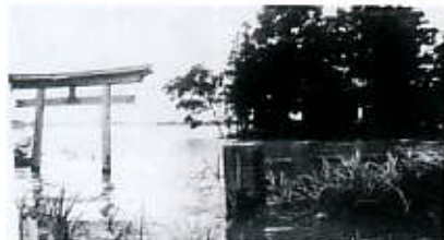
水没した谷中村雷電神社付近

鉱毒問題の世論喚起の反応は、時の内閣に第二次鉱毒調査委員会を設けさせました。ところが、この委員会の「足尾銅山に関する調査報告書」(明治36年3月)は、「渡良瀬・利根及び思川の三川が合流する付近」に遊水池を設ける必要性を方向付けました。埼玉県川辺・利島村の遊水池計画は、県の段階でつぶれましたが、栃木県谷中村の買収計画は、明治36年1月10日に臨時議会で具体化しました。